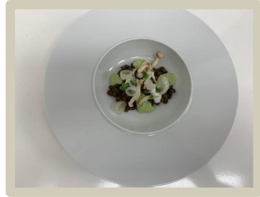
2 e Gang: Pittige linzen met koriander en gekonfijte ui