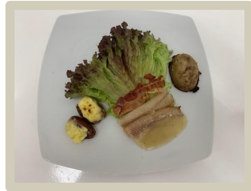
4 e Gang: Gerookte paling met zuurkool bouillon, dadels en zolderspek