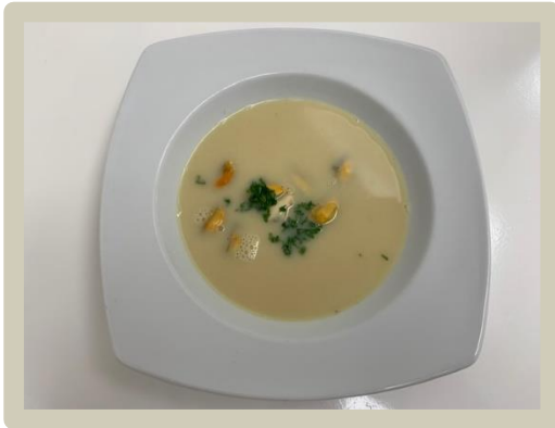
3 e Gang: Venkelsoep met clams en kerrie-olie