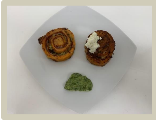
1 e Gang: Tomaat - pastarolletjes