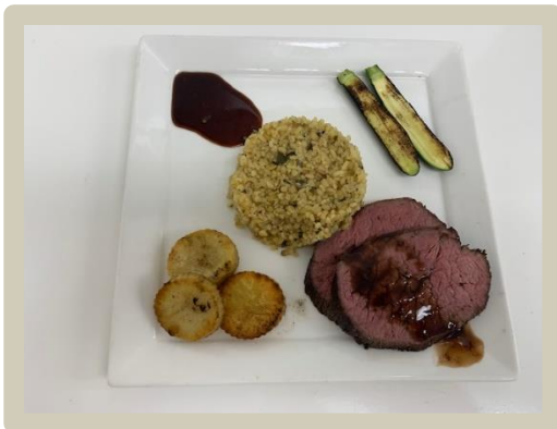
5 e Gang: Rosbief met courgette, sjalot en jus van gepofte knoflook