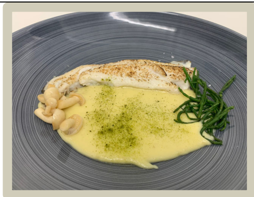
3 e Tussengerecht 1: Scholfilet met aardappel- roomsaus