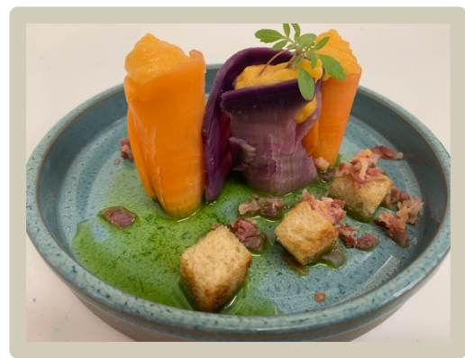
2 e Voorgerecht: Met kaascrème gevulde bataat- rolletjes