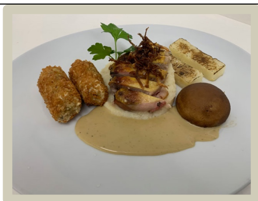
5 e Hoofdgerecht: Fazant met knolselderij en boschampignons