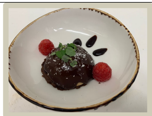
6 e Dessert: Chocolade bavarois bol met frambozen