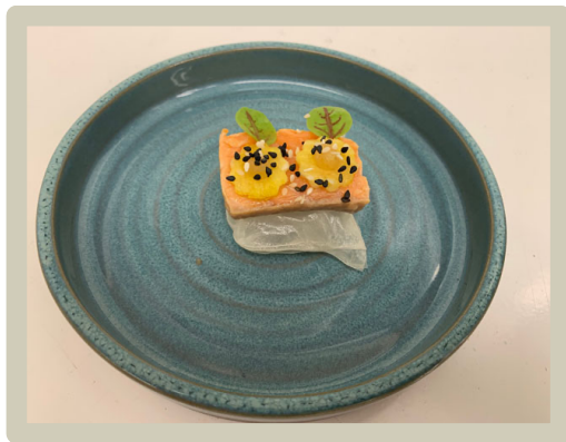
1 e Amuse: Rijstpapier kussentjes met zalm en appel