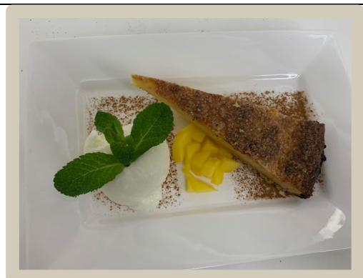
6 e Dessert: Spaanse cheesecake met sorbet van yoghurt