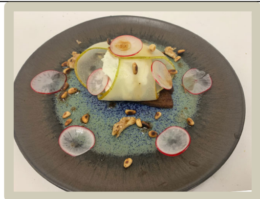
4 e Tussengerecht Varkensbuk en espuma van Bleu d'Auvergne