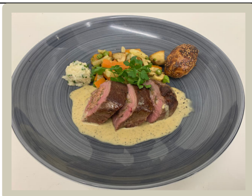
5 e Hoofdgerecht: Rouleaux van eend met een romige truffelsaus