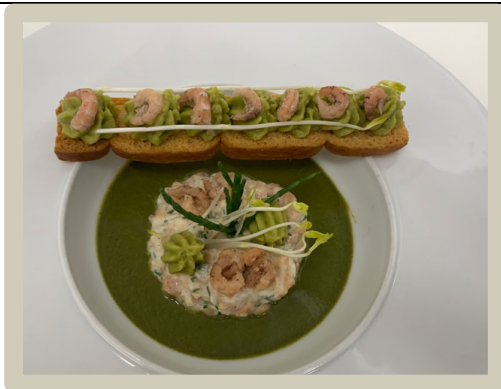
3 e Soep: Crèmesoep van raapsteeltjes met zalmtartaar