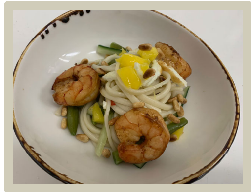
2 e Voorgerecht: Noedelsalade met garnalen