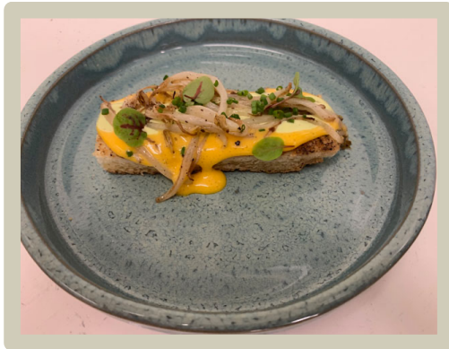
1 e Amuse: Briochet toast, taugé en eidooiercrème