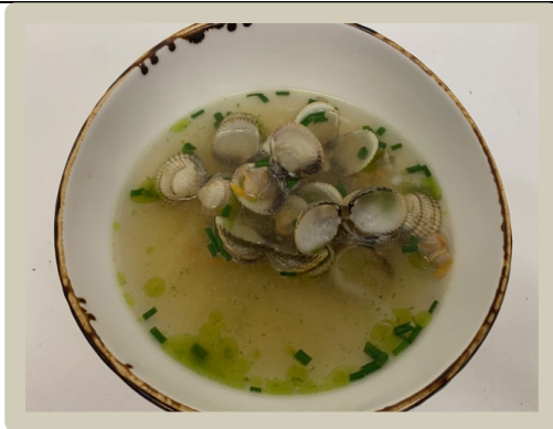
3 e Soep: Dashi van witte ui met schelpjes en bosui