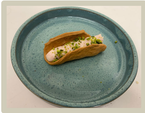
1 e Amuse: Parmezaan taco met mortadella mousse