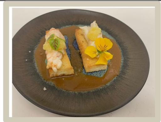
4 e Tussengerecht: Gamba's met bisque van Straffe Hendrik