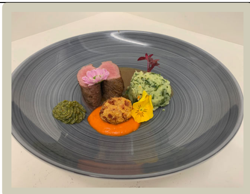
5 e Hoofdgerecht: Lamsfilet met geitenkaaskroketje