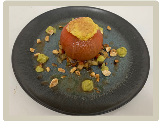
2 e Voorgerecht: Tomate farcie