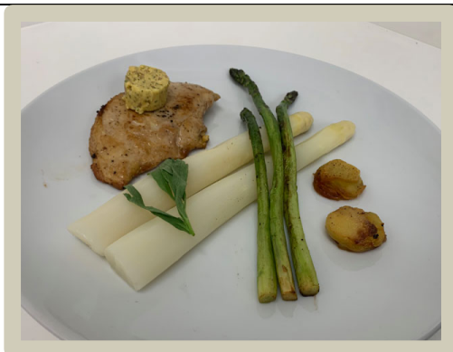
5 e Hoofdgerecht: Suprême van parelhoen, boter, Café de Paris met asperges