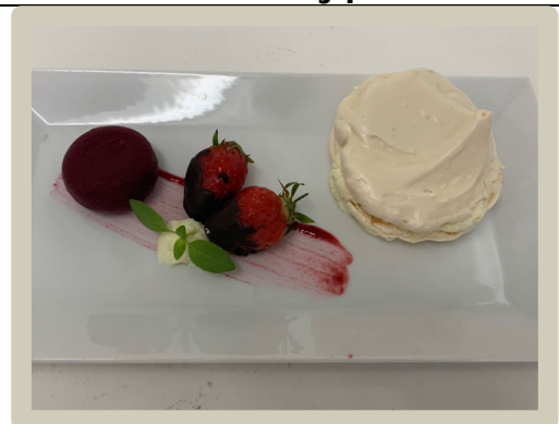
6 e Dessert: Pavlova, rabarber en Limoncello