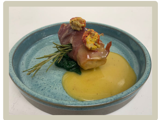
2 e Voorgerecht: Lotte op een bedje van spinazie