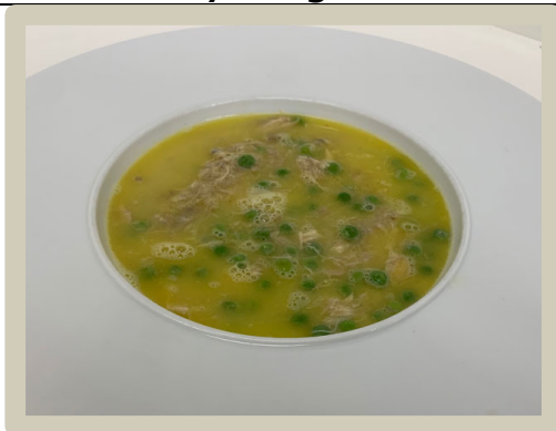
3 e Soep: waterzooi met parelhoen, asperges en erwtjes