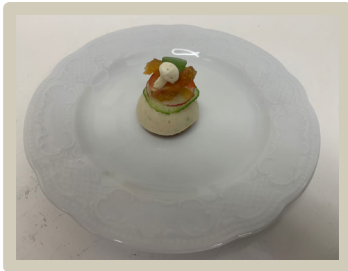
1 e Amuse: Palingmouse, lente groenten, yuzu gel